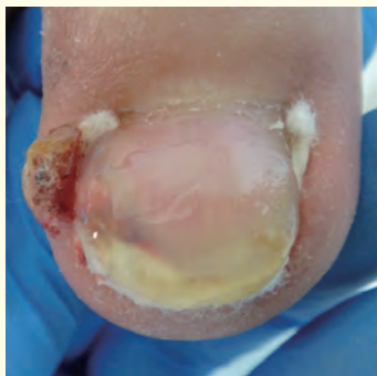
1カ月後 矯正処置直後