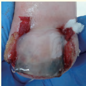
初日 矯正処置直後