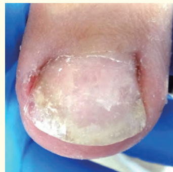
2カ月後 矯正処置直後